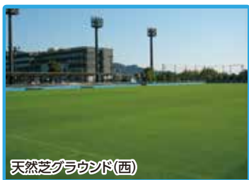
天然芝グラウンド(西)