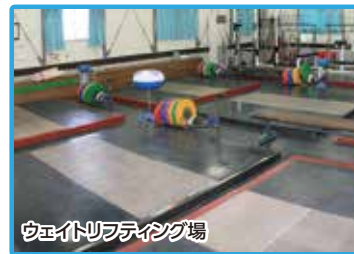
ウェイトリフティング場