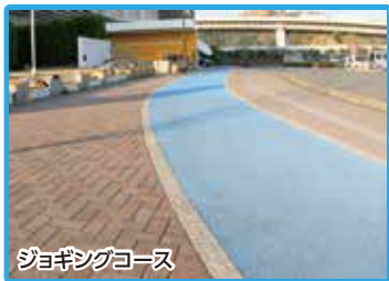
ジョギングコース