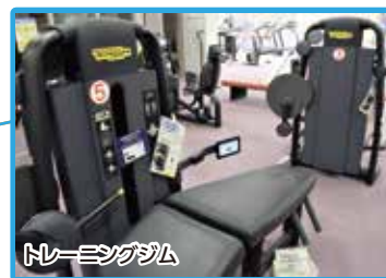
トレーニングジム