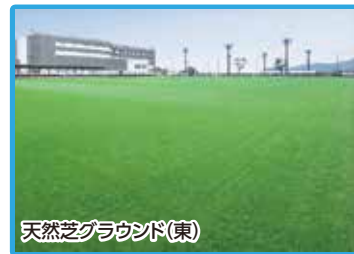
天然芝グラウンド(東)